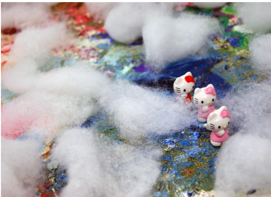
Stillbilder ur Så långt handen når 2013

Mina filmer finns på min hemsida, www.katrinatapio.net samt på youtube