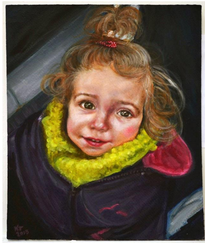
Porträtt av en väninnas dotter Akryl på trä, 120x80 cm, 2013