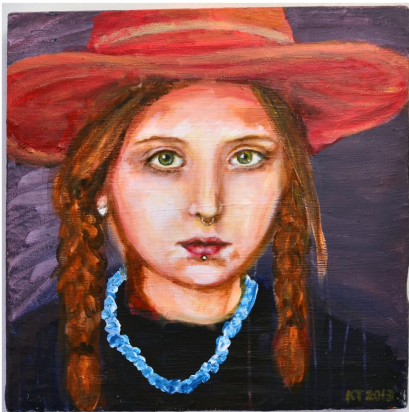
Självporträtt Akryl på duk, ca 60x60 cm, 2013