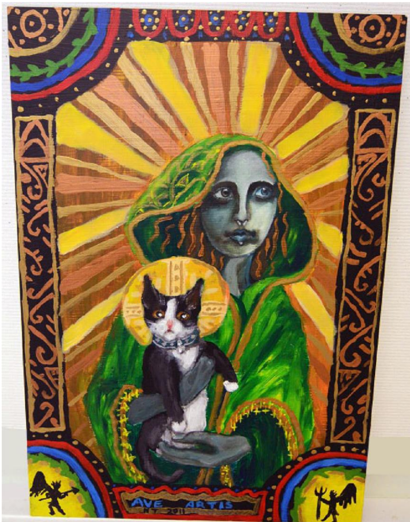
Ave Artis Akryl på trä, 100x50 cm, 2011