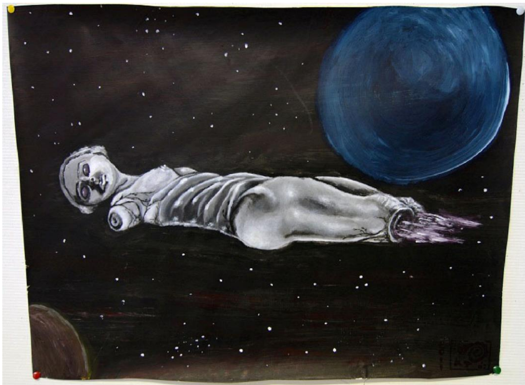
Spacecraft Akryl på papper, 21x29cm, 2011