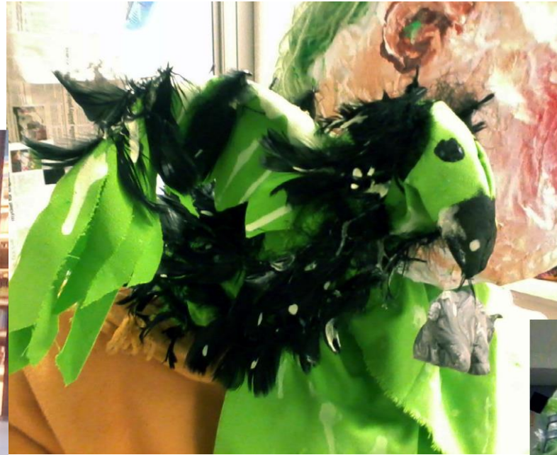
Nysa, förkylningens Gudinna Skulptur i blandade material, med ljudinstallation, ca 160x60 cm, 2013