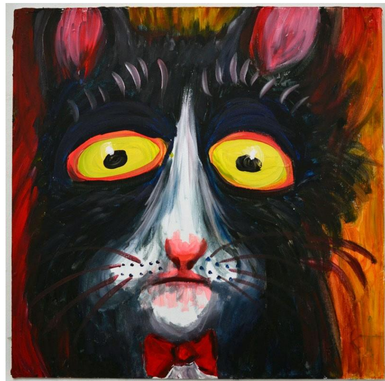
Arkimedes Akryl på trä, 60x60 cm, 2013